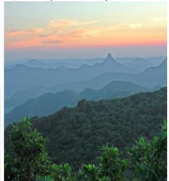
帽兒山林場林海風光